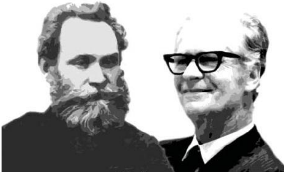
Pavlov e Skinner