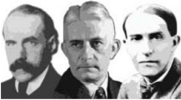
Wertheimer, Köhler e Koffka.